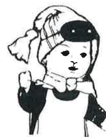
Confrérie Saint Pansard de TRÉLON