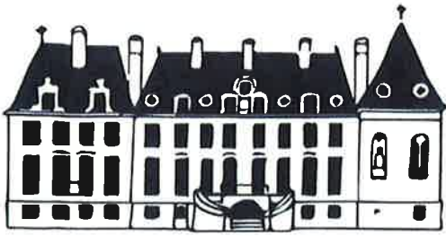
ASSOCIATION HISTORIQUE DU CHÂTEAU DE TRELON

L'Association historique de château de Trélon, avec l'aide logistique et matérielle de la municipalité, organise une conférence avec exposition de documents intitulée « 1962, des Harkis à Trélon ; témoignage d'un exode oublié ».