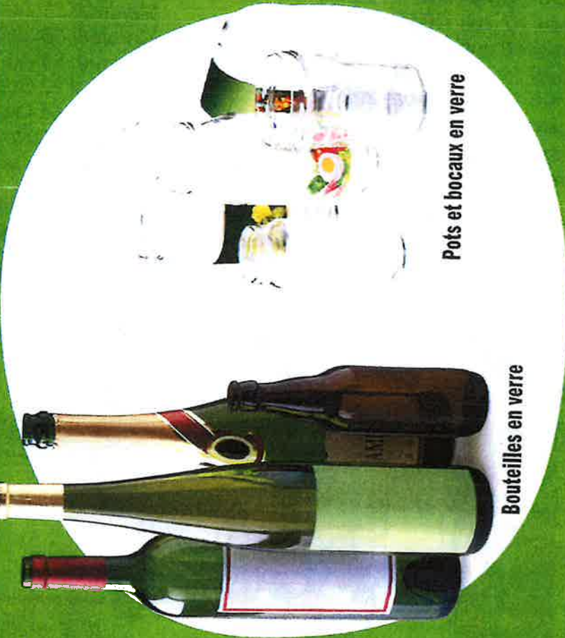
Pots et bocaux en verre