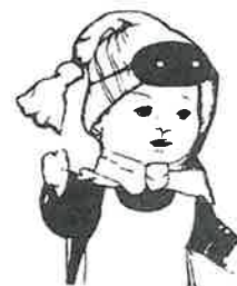
Confrérie Saint Pansard de TRÉLON